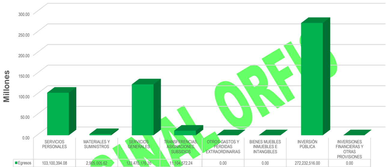
GRÁFICA 2 EGRESOS